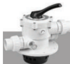
† Válvula multiport de seis posiciones